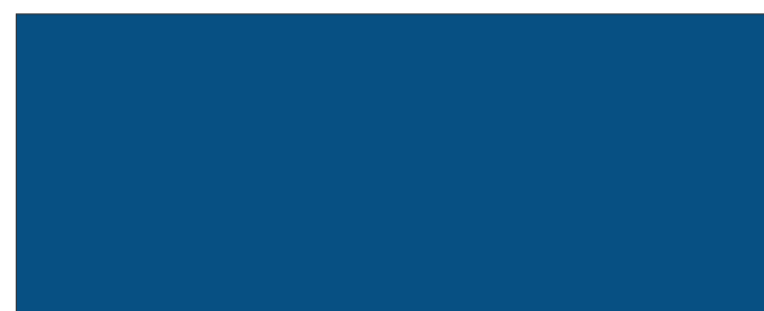
Niebieska RAL 5010