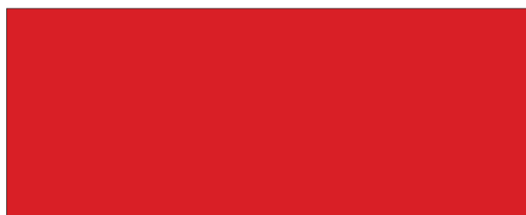
Czerwona Jasna RAL 3020